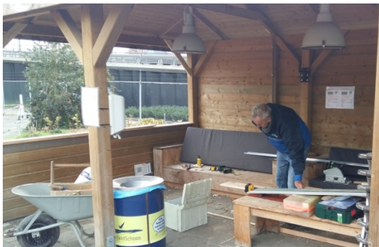
Minder jong vakmanschap

Er is de afgelopen tijd ook hard gewerkt aan het winddicht (schuiframen) maken van de overkapping. Dat is nog een Club van 50 cadeautje. Kom snel een keer kijken en voelen wat voor effect dit heeft. Alle plexiglas is geplaatst en het blauwe folie is verwijderd dus laat de winter maar komen.